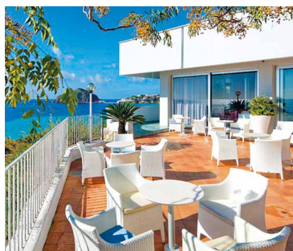
Terrasse mit Meersicht